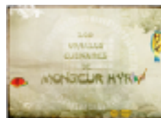
Les oracles culinaires de Monsieur Hyk (2014)

portraits sonores et photographiques d'habitants et acteurs d'un territoire