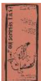
Qui sommes-t'ils ? (1998) d'après les écrits de Daniil Harms