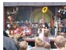
La baraka'clowns (2005) attraction foraine