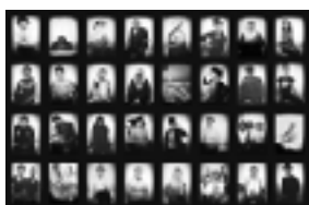
Instants de portraits (2016 et 2018)

portraits sonores et photographiques d'habitants et acteurs d'un territoire