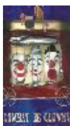
Combat de clowns (2003) théâtre forain